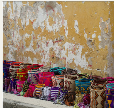
Au Pair en Amérique Latine