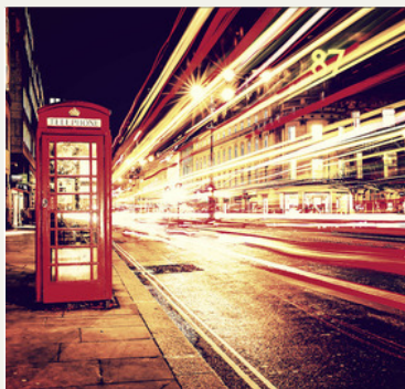
Au Pair en Europe