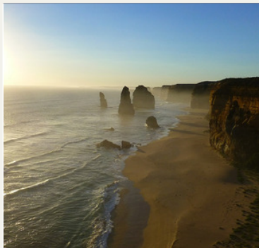
Au Pair en Australie et Nouvelle Zélande