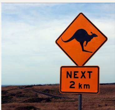
Travailler dans une ferme