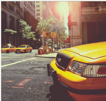
Au Pair in America