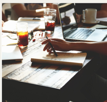
Cours de langue à l'étranger