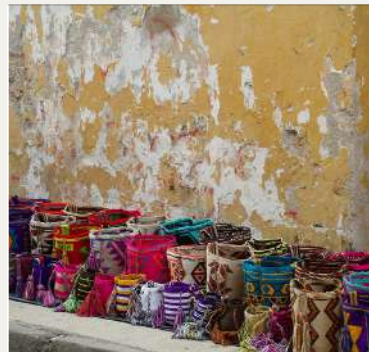
Au Pair en Amérique Latine