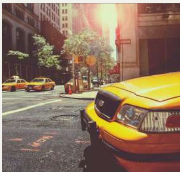
Au Pair in America