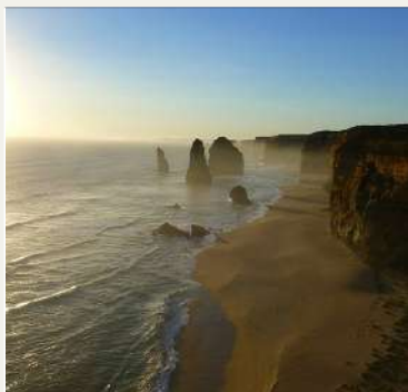
Au Pair en Australie et Nouvelle Zélande