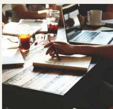
Cours de langue à l'étranger