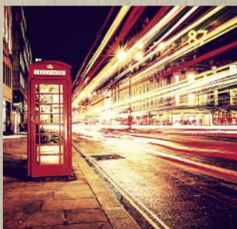
Au Pair en Europe