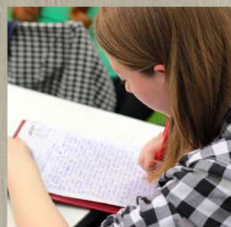
Cours de langue à l'étranger