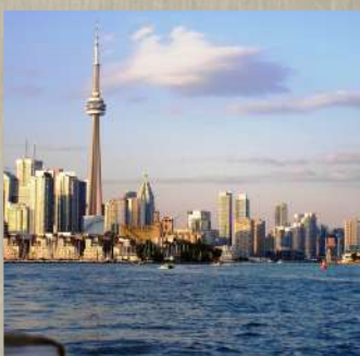
Jobs, stage à l'étranger