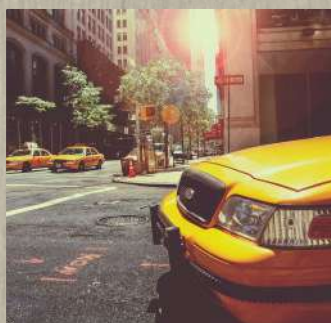
Au Pair aux Etats-Unis