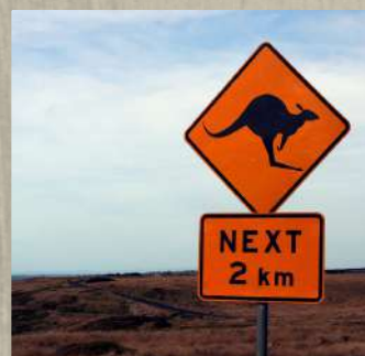
Au Pair en Australie et Nouvelle-Zélande