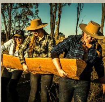
Travail à la ferme