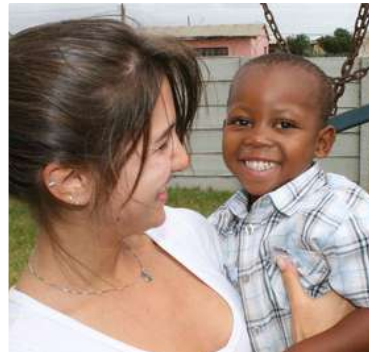
Bénévolat à l'étranger