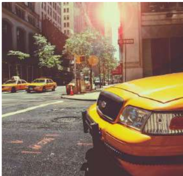
Au Pair in America