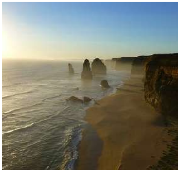
Au Pair en Australie et Nouvelle Zélande