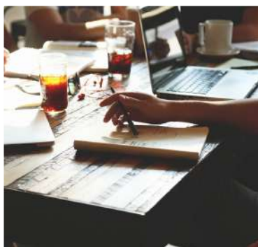
Cours de langue à l'étranger