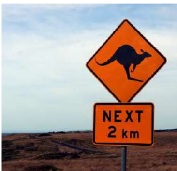
Travailler dans une ferme