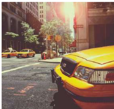
Au Pair in America