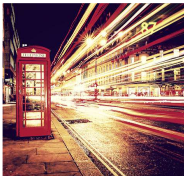
Au Pair en Europe