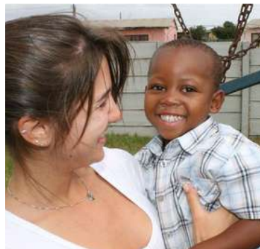
Bénévolat à l'étranger