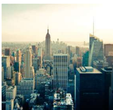
Demi Pair, Jobs, Stages